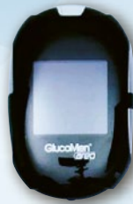
En GlucoMen Areo blodsockermätare